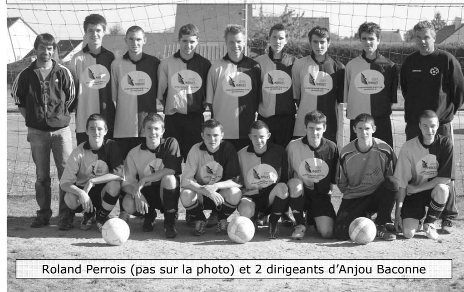
Roland Perrois (pas sur la photo) et 2 dirigeants d'Anjou Baconne